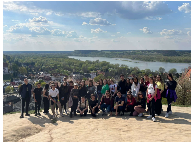
Gruppo Erasmus al completo a Lublin.

Giovedì 27 aprile i gruppi hanno lavorato a scuola alternando attività all'aperto, gara di preparazione di pierogi, un piatto tipico polacco; Making Graffiti in cui ogni nazione ha espresso su cartelloni la propria idea di solidarietà e cosa ha significato l'esperienza in Polonia per loro. Come conclusione della giornata cena con cucina polacca e Disco.