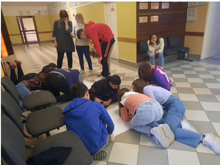
Il gruppo italiano al lavoro