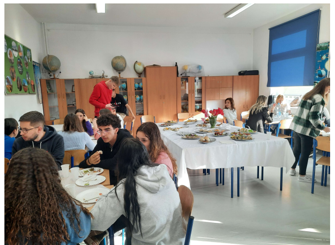
Cena con degustazioni di piatti tipici polacchi.