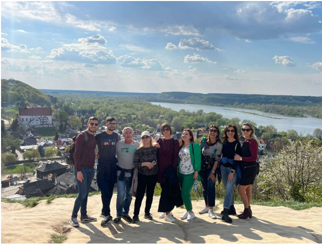
Vista panoramica di Lublin. Gruppo insegnanti.