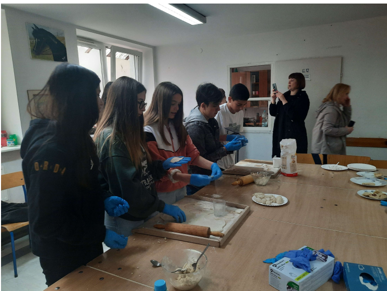
Il gruppo italiano alle prese con la gara di preparazione dei pierogi.

Giovedì 27 aprile i gruppi hanno lavorato a scuola alternando attività all'aperto, gara di preparazione di pierogi, un piatto tipico polacco; Making Graffiti in cui ogni nazione ha espresso su cartelloni la propria idea di solidarietà e cosa ha significato l'esperienza in Polonia per loro. Come conclusione della giornata cena con cucina polacca e Disco.