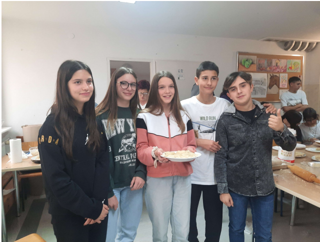
Il gruppo italiano è stato premiato come il migliore nella preparazione dei pierogi.